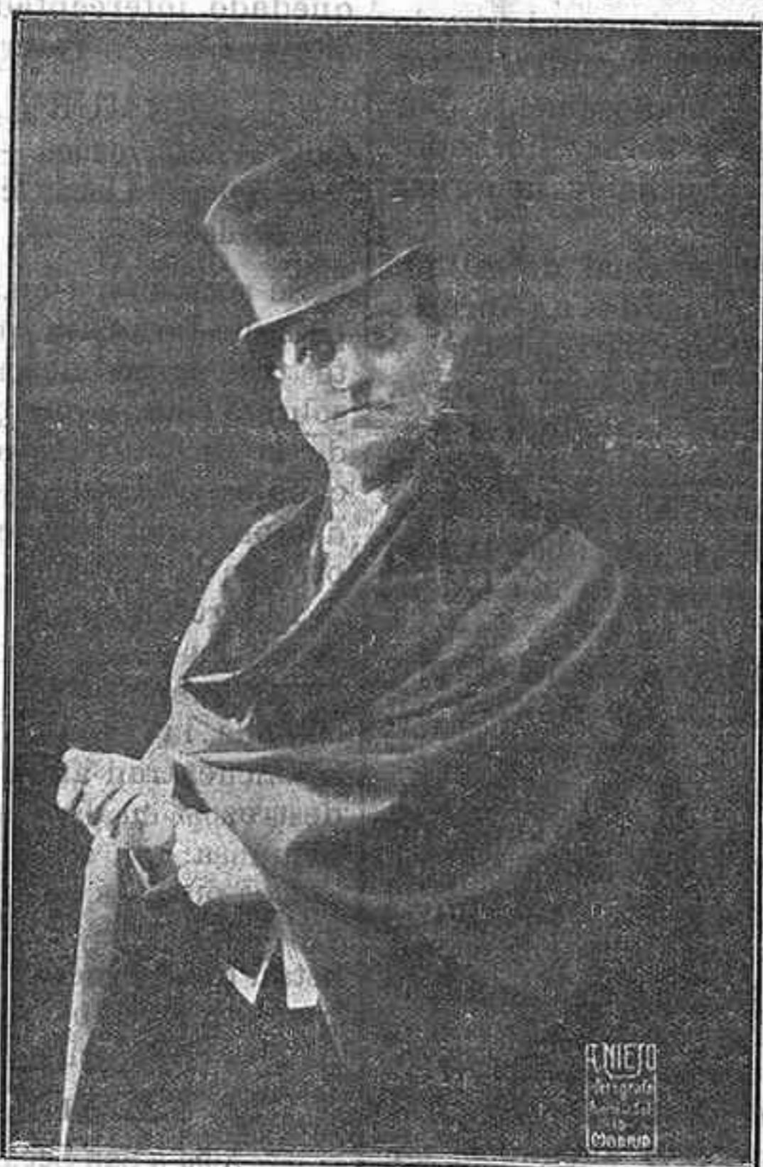
El eminente baritono SAGI-BARBA, que actúa en el teatro Bretón, en su papel de CONDE DANILÓ, de la VIUDA ALEGRE.

Sagi-Barba: he ahí un nombre que, repetido por la fama, hoy resuena en hogares y plazas salmantinas. Pero, ¿le conocéis? Aquí, que todo se interviene, razón era abocarse con don Emilio, y, cuartillas en mano y pluma en ristre, buscamos la presentación, y hemos aquí frente por frente primero, y después sentados en sen-