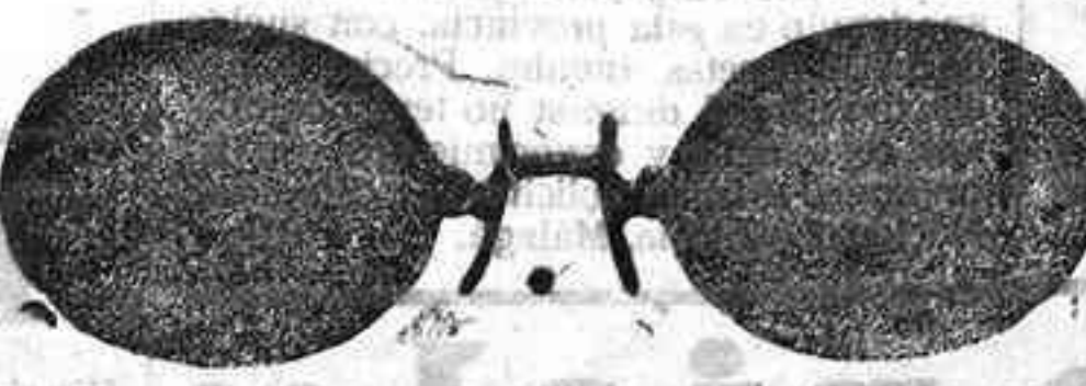
Este modelo, en níquel, 5 pesetas.

Gran surtido en relojes finos y corrientes, en ORO, DE SEÑORAY CABALLERO; relojes de plata, acero y níquel, marcas escogidas; despertadores de bolsillo con esferas Radio. RELOJ, ORO DE LEY, en correa, para caballero o señora, 40 pesetas; en níquel, 7.