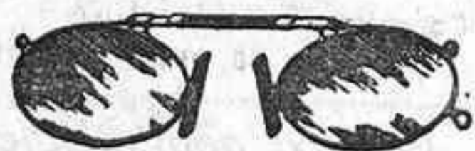
Lentes o Gatas de CRISTAL ROCA, 5 Pesetas.