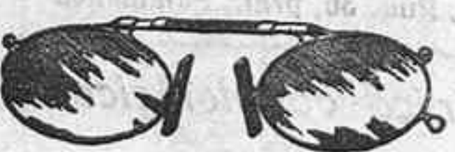
Lentes o Gatas de CRISTAL ROCA. 5 Pesetas.