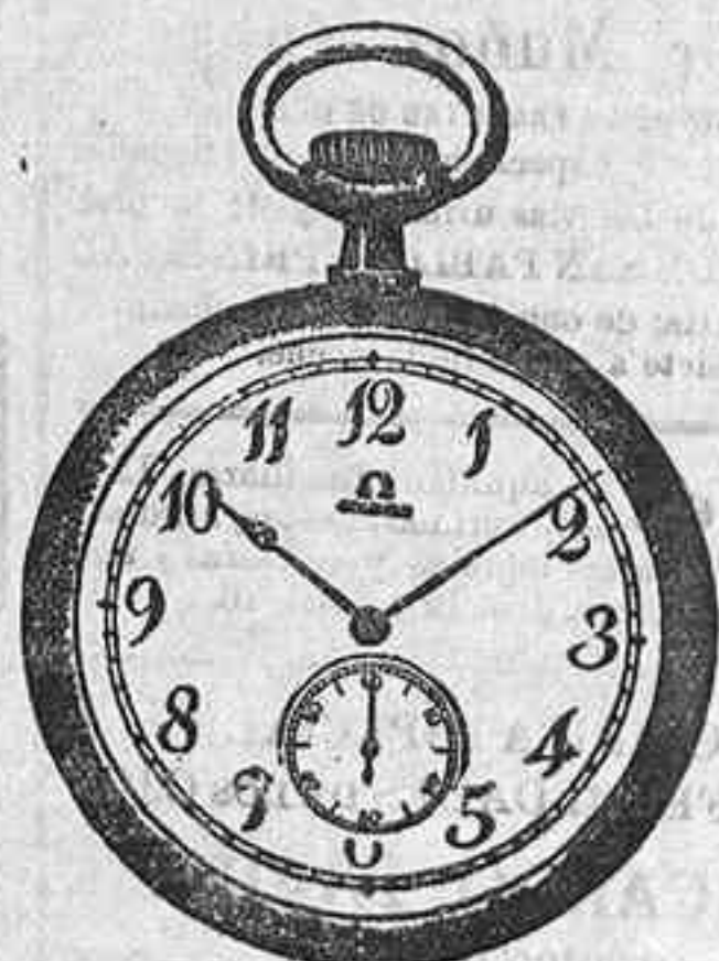
OMEGA LEGITIMO, a 27 Pesetas.