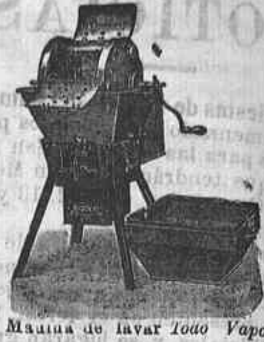
Máquina de lavar Todo Vapor

Util á todos: desde la familia más reducida hasta los más grandes establecimientos.