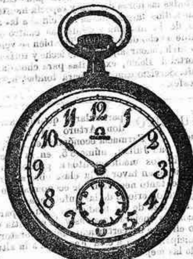
OMEGA LEGITIMO, a 27 Pesetas.

Esta casa tiene demostrado, y ninguna otra puede dar las ventajas en todos sus artículos, (cuenta modelos de relojes de oro de caballero y señora, en repeticiones, Cronómetros, Cronógrafos y otros en marcas «Omegas», «Juvenias», «Longines», «Ancoras» de precisión de varias marcas. Relojes corrientes en plata, acero, níquel y fantasia en marcas «Omega», «Long», «Waltan» e infinidad de clases y ma cas. Relojes pulseras en oro, plata y chapado. Relojes de pared, estilo inglés, roble, nogal y caoba; modelos exclusivos en carrillón o cuartos y corrientes. Despertadores, sobre mesa y corrientes. Despertadores gran fantasia. Medallas y cadenas.