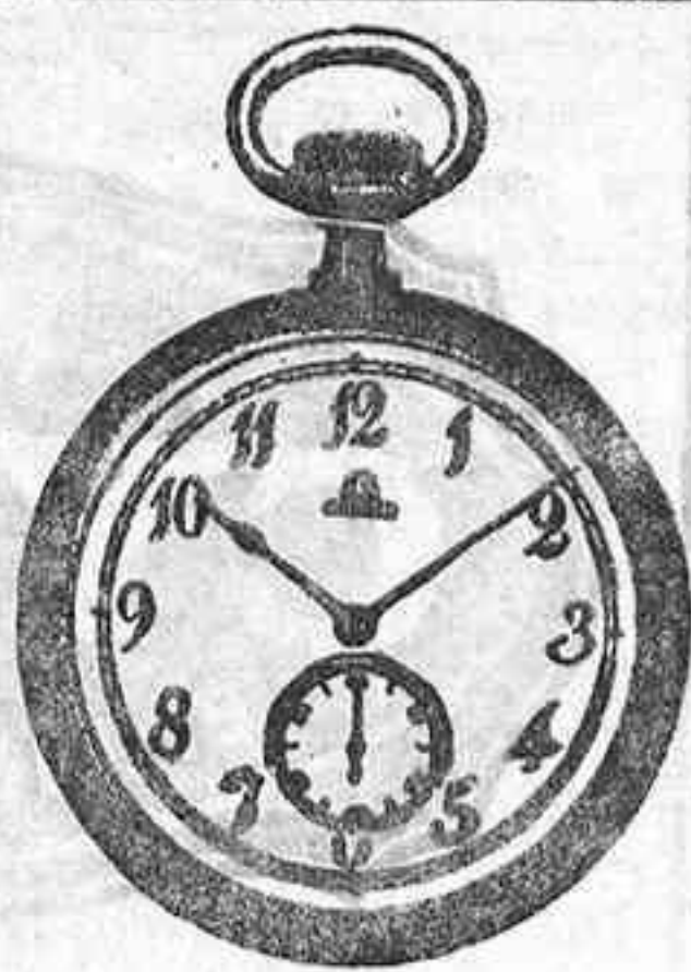
OMEGA LEGITIMO, a 27 Pesetas.

Esta casa tiene demostrado, y ninguna otra puede dar las ventajas en todos sus artículos, oculta modelos de relojes de oro de caballero y señora, en repeticiones, Cronómetros, Cronógrafos y otros en marcas «Omegas», «Juvenias», «Longines», «Ancoras» de precisión de varias marcas. Relojes corrientes en plata, acero, níquel y fantasía en marcas «Omega», «Long», «Waltan» e infinidad de clases y marcas. Relojes pulseras en oro, plata y chapado. Relojes de pared, estilo inglés, roble, nogal y caoba; modelos exclusivos en carrillón o cuartos y corrientes. Despertadores, sobre mesa y corrientes. Despertadores gran fantasía. Medallas y cadenas.