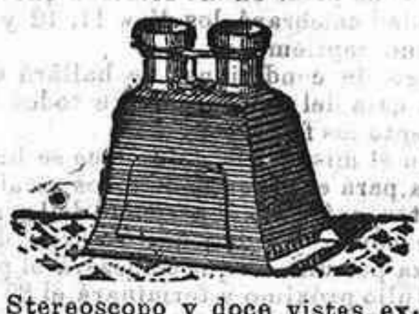
Stereoscopy and doce vistas exposición de 1900, 12'50 PTS.

PLACAS Y PAPELES DE LUMIERE, GUILLENINOT, ST. CLAIR, DIESEGANG, AMERICANAS Y ALEMANAS