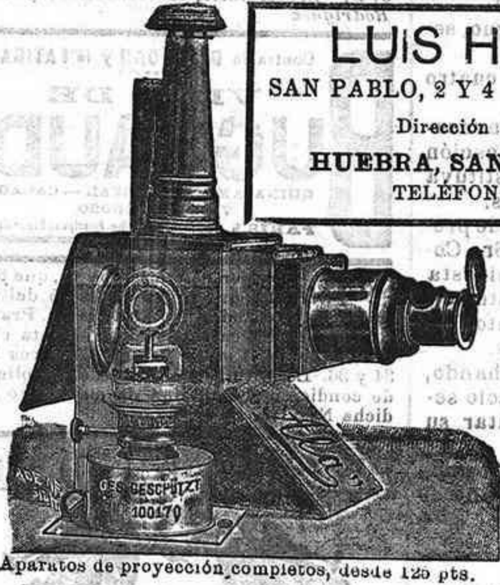
Aparatos de proyección completos, desde 120 pts.

LUIS HUEBRA SAN PABLO, 2 Y 4 SALAMANCA Dirección telegráfica: HUEBRA, SAN PABLO, 2 Y 4 TELEFONOS, 38 Y 41