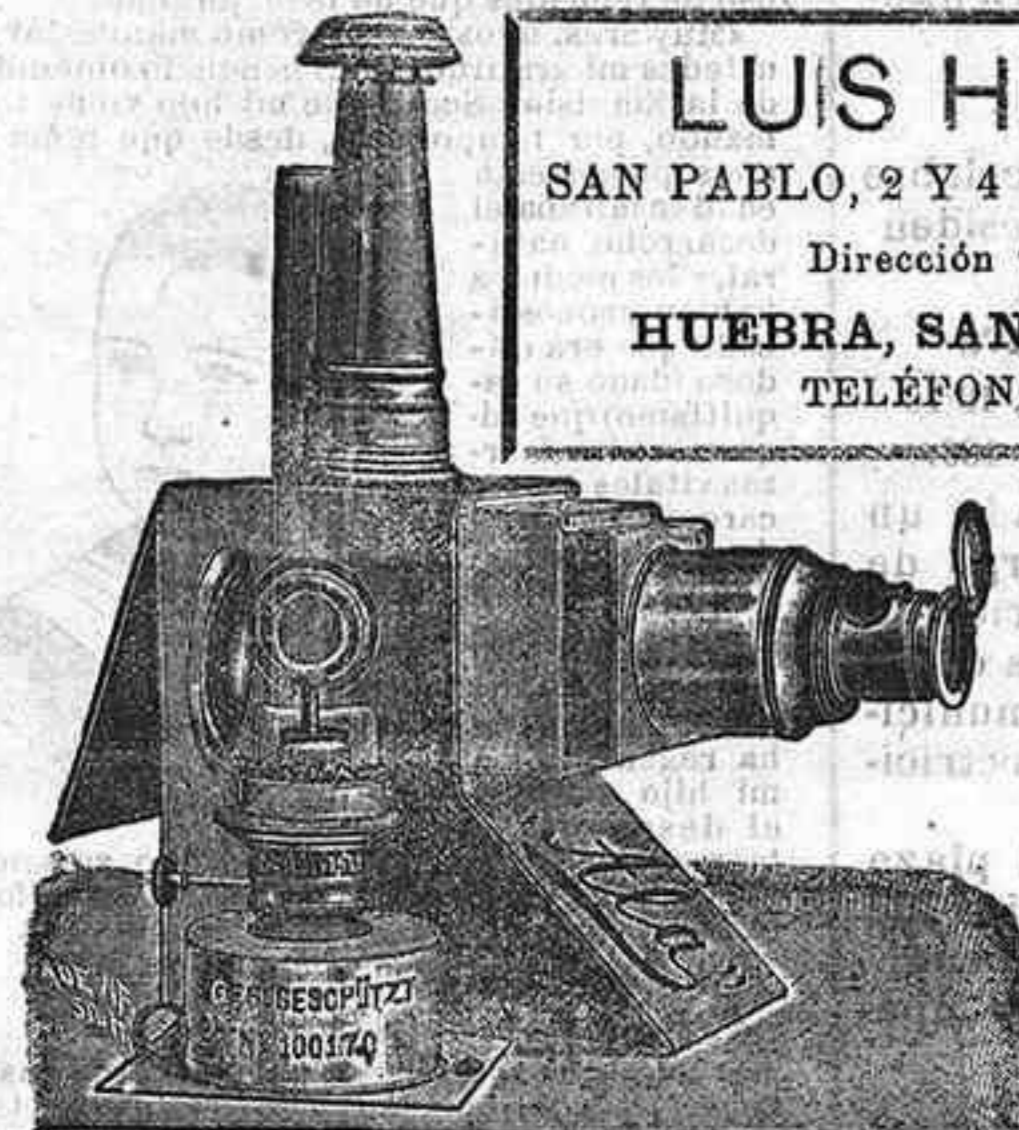
Aparatos de proyección completos, desde 120 pts.

LUIS HUEBRA SAN PABLO, 2 Y 4 SALAMANCA Dirección telegráfica: HUEBRA, SAN PABLO, 2 Y 4 TELÉFONOS, 88 Y 41