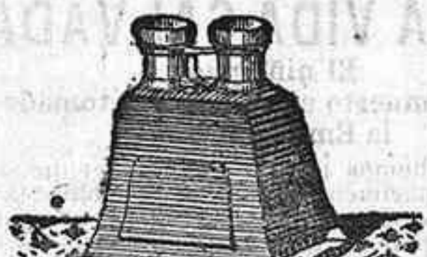
Stereosco y doce vistas en posición de 1900, 12'50 PTS.

PLACAS Y PAPELES DE LUMIERE, GULLENINOT, ST. CLAIR, LIESEGANG, AMERICANAS Y ALEMANAS