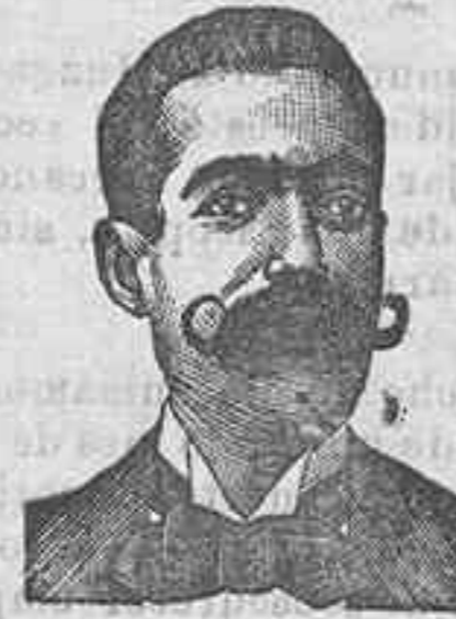
A. SALVATI COSTANZI

Preparación la más racional para curar la tuberculosis, bronquitis, catarrros crónicos, infecciones gripales, enfermedades convulsivas, inspección, bilidad general, restricción nerviosa, neurastenia, impotencia, enfermedades mentales, caries, raquitismo, escrofulismo etc. FRANCO, 27. pesetas; DEPÓSITO: Farmacia del Dr. Benedicto, San Bernardo, 41, Madrid.