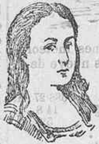
Juana de Arco

Con el triunfo obtenido, Juana de Arco fué declarada ídolo del pueblo; pero esto no impidió que el desgraciado Carlos VII, cediendo a las intrigas de sus consejeros y de sus generales, la abandonaron cuando