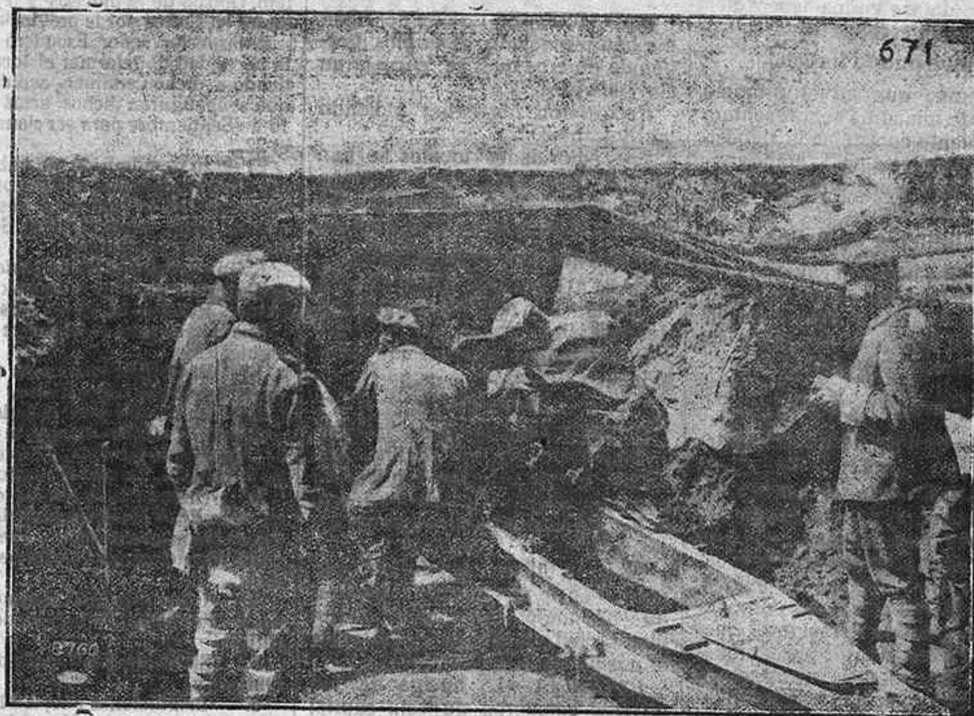
Mo tero alemán, de 15 centímetros, que hace fuego en las cercanías de Albert.—Tropas wirttenburguesas.