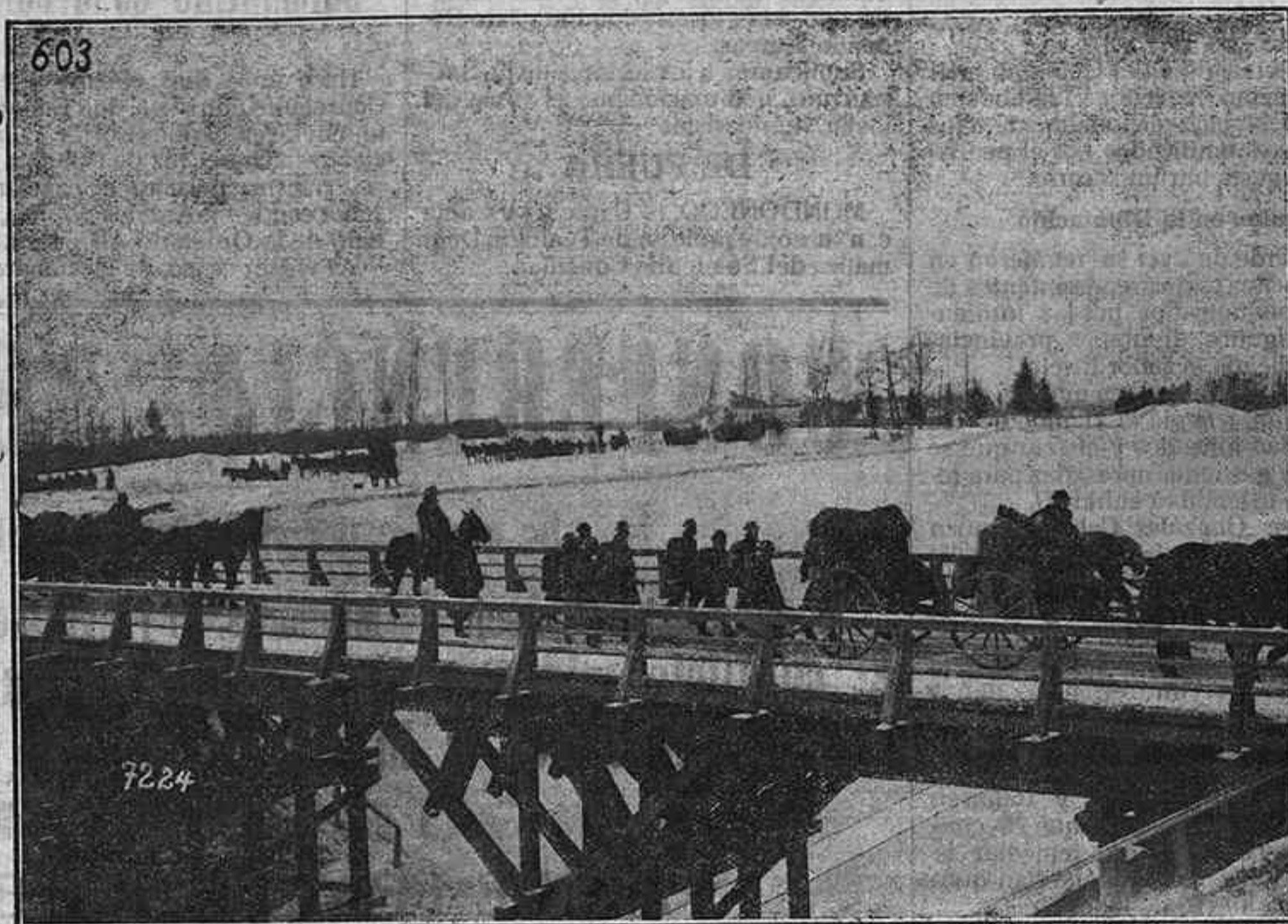
El avance de los alemanes en Rusia.—Tropas alemanas atraviesan la vía férrea de Riga-San Petersburgo.