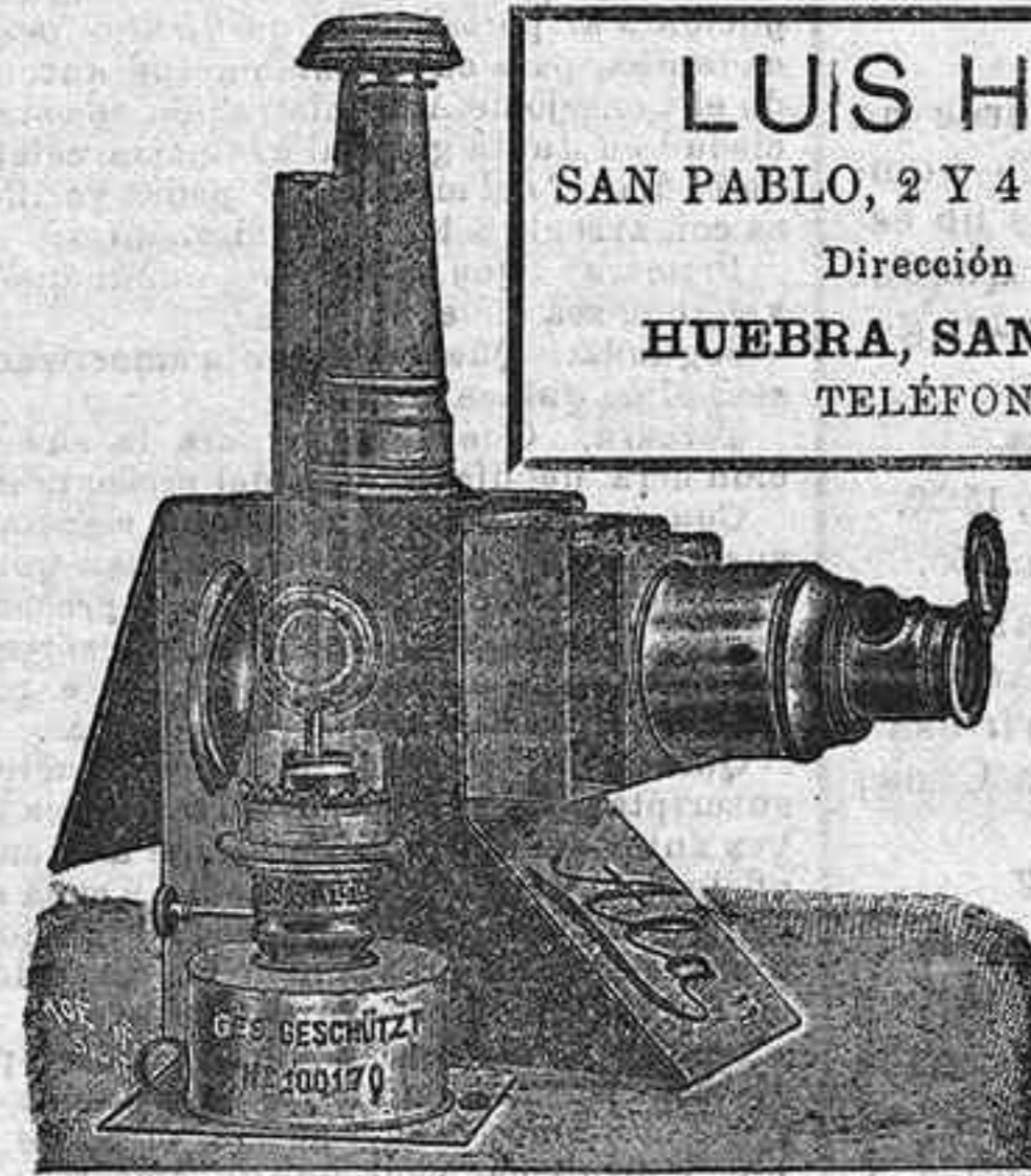
Aparatos de proyección completos, desde 125 pts.

LUIS HUEBRA SAN PABLO, 2 Y 4 SALAMANCA Dirección telegráfica: HUEBRA, SAN PABLO, 2 Y 4 TELÉFONOS, 88 Y 41