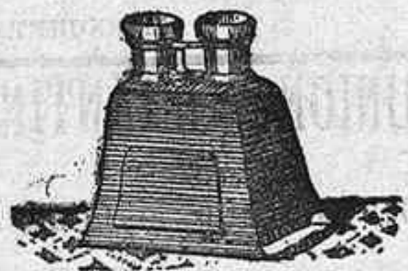
Stereoscope y doce vistas en posición de 1900, 12'50 PTS.

PLACAS Y PAPELES DE LUMIERE, GUILLENINOT, ST. CLAIR, LIESEGANG, AMERICANAS Y ALEMANAS