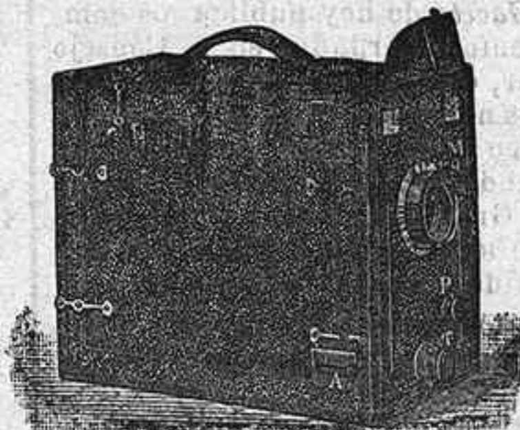
Le Ganga Le Lindo cosmos