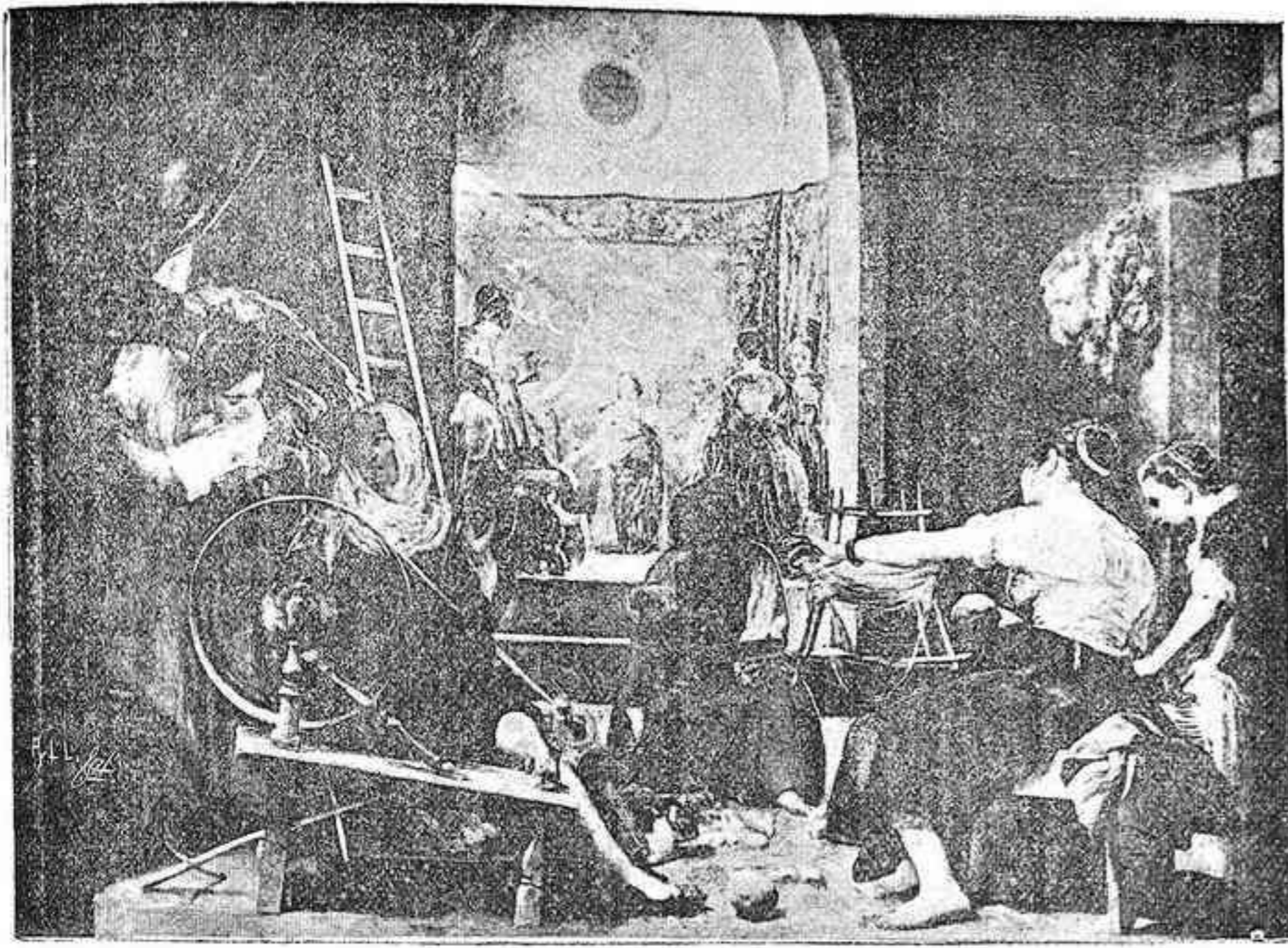
Cuadro de Velázquez, existente en el Museo de Madrid.