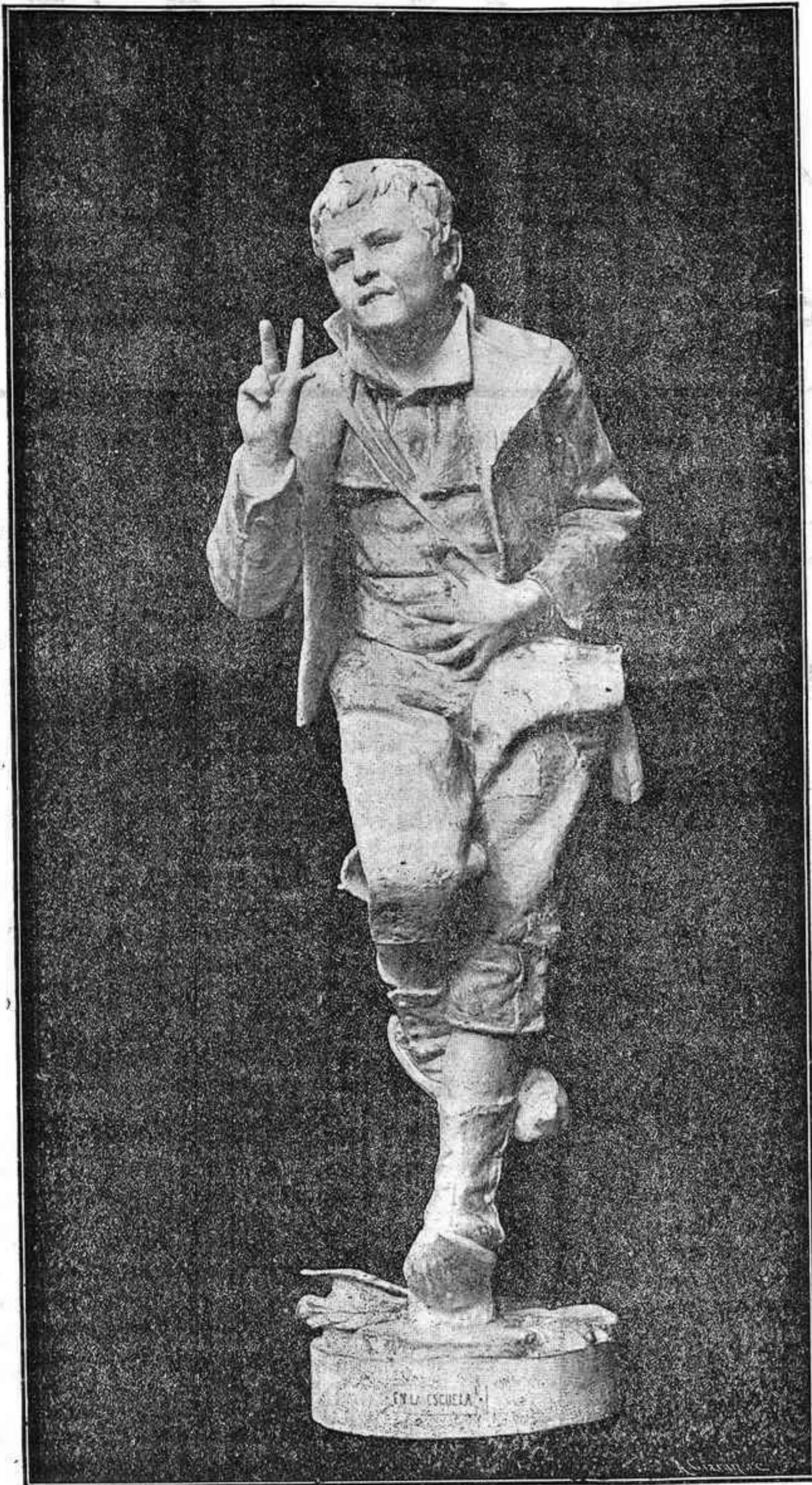
Escultura de Rafael Galán.