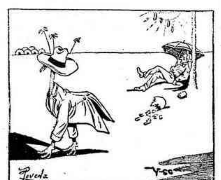
—¡¡Cielos!! ¡Mi ropal!