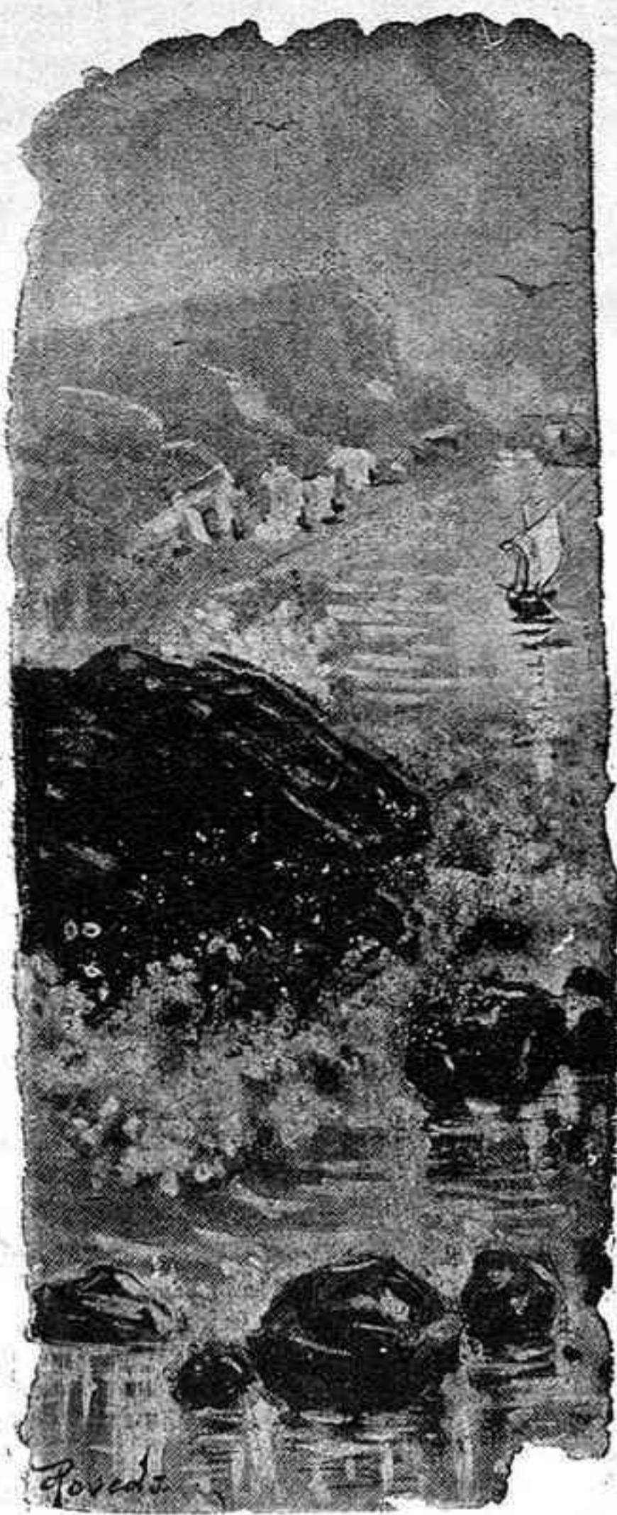
Boceto de una marina.

á cambio de un voto, son capaces hasta de levantar un muerto.