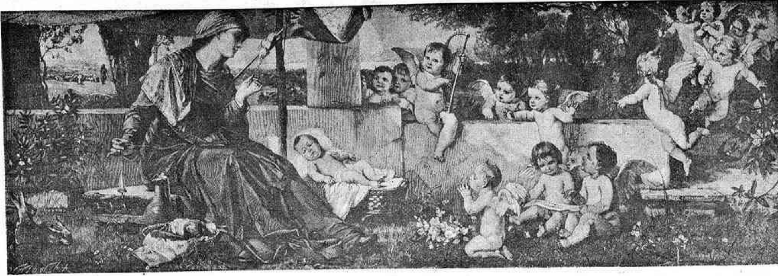
La canción de una madre.