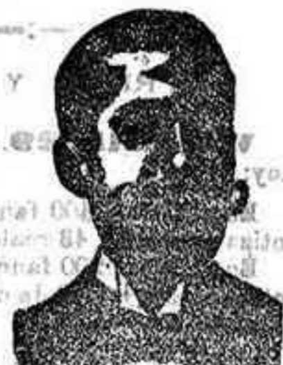
An gels Costanzi Dip. 435, Barcelona

Miles y miles de celebridades médicas, después de una galar experiencia se han convenido y certificado, que para curar radicalmente en dos ó tres días la purgación reciente y en cinco ó seis días la crónica, gota militar, úlceras, flujo blanco de las mujeres, aronías, catarro de la vejiga, escozoros uretrales; cálculos, retención de orina, y en veinte ó treinta días los estreñimientos uretrales (estrechez), aunque sean crónicos de más de 20 años, evitando las peligrosísimas sondas, no hay medicamento más milagroso que los CONFITES ó Inyección Costanzi. También certifiican que para curar cualquier enfermedad sífilítica, en vista de que el Iodo y el Mercurio son dañinos para la salud, nada mejor que el ROOB Costanzi, pues no sólo cura radicalmente la sífilis, sino que estriba los malos efectos que producen estas substancias, que como es sabido causan enfermedades no muy fáciles de curar. El inventor Angelo Costanzi, calle Diputación, 845, Barcelona, seguros del buen éxito de estos específicos, mediante el trato especial con él, admite a los incrédulos el pago una vez curados. Precio de la inyección, pesetas 5. Confites antivenéreos para quienes no quieren usar inyecciones, pesetas 5. Roob antisifilítico y antiherpético, pesetas 4. De venta en todas las buenas farmacias. En SALAMANCA, en la de los señores Hijos de Villar y Pinto plaza de la Verdura, 5 y 7. Consultas médicas en Barcelona, calle de la Diputación, 435, entrepuerto segundo, todos los días, miércoles y viernes.