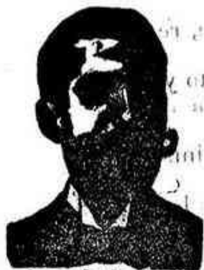
Angeles Costanzi Dip. 436, Barcelona

Ó INYECCION ANTIVENÉREA Y ROOB ANTISIFILÍTICO COSTANZI