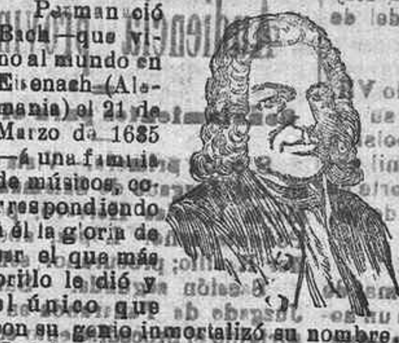
JUAN SEBASTIAN BACH

«La Música debe á Bach, dijo Schumann, lo que una religión debe á su fundador. Gen. cit.». Frase del célebre compositor se hace alusiva y justo elogio del que con razón es tenido por padre de la Música moderna, del que no obstante haber sido agasajado con muchas honras y merecidos por reyes y príncipes, no fué estimado como compositor en cuanto valía hasta bastante después de su muerte.