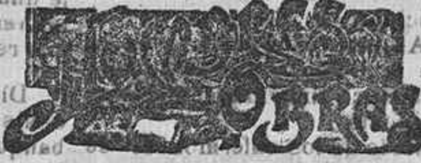
Teodoro de Banville 15 de Marzo

Barcelona 15 - 8.15. Mercado encalmado, pero los precios firmes. Se han hecho ventas de trigo de Sigüenza a 45 reales fanega; de Sa- lamanca, superior y bueno en con- junto, a 45; de Penafanda, muy bueno, con tarifa de Salamanca, a 45; de Valladolid, a 45.50; de Tarazona a 45.75; y de Azeite, superior, a 45.14. - ROLDÓS.