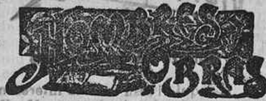
DIAZ DE BENJUMEA

Terminó diciendo que si se ponen valias al obrero las saltará y que si no aducia soluciones era porque el proyecto no se presta á ello.