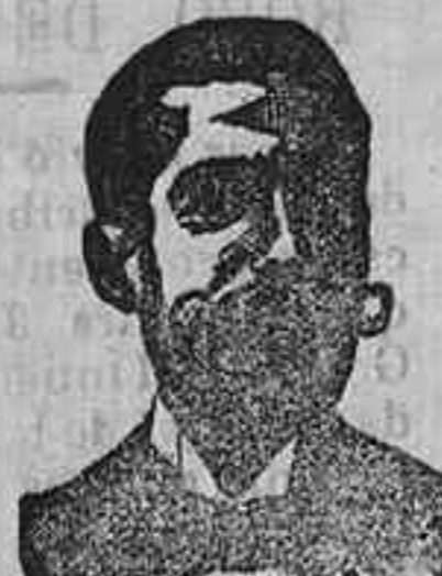
Angelo Costanzi Dip. 435, Barcelona

(anagrama) de ANDRES Y FABIA, farmacéutico premiado en Valencia. Causa aplicación es un nuevo testimonio de su brillante éxito destruyendo al propio tiempo la fealdad que la carie comunica al paciente. Este remedio no es un preventivo como lo son todos los elixires que se anuncian, sino que combate y VENCE EN EL ACTO a esos dolores, que parece que van a agotar los horrores del sufrimiento. De venta, señores Villar, farmacia, plaza de la Verdura y principales de la ciudad a dos pesetas bote.