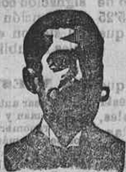
Angelo Costanzi Dip. 435, Barcelona

Resolución, inflamación, rejas e protitis que resalta al MATARDOLO (Pasta Miliar) e gratis, en las boticas de España. Infalible infante que siempre cura. Consulta gratis, y un correo por 2.50 pesetas, en sellos e Dr. Navarro, Alcalá, 23, MADRID.