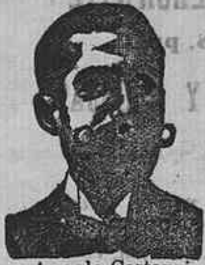
Angelo Costanzi Dip., 345, Barcelona

Preparación la más acionada para curar la tuberculosis, catarros crónicos bronquiales, infecciones gripales, enfermedades consuntivas, inapetencia, debilidad general, postración, nerviosa neurastenia, impotencia, enfermedades mentales, caries, raquitismo, escrofulismo etc. Frasco 2'50 pesetas. DEPÓSITO: Farmacia del Dr. Benedicto, San Bernardo 41, Madrid y en la provincia Salamanca, de farmacia del Lico. Rodilla. Guijuelo.