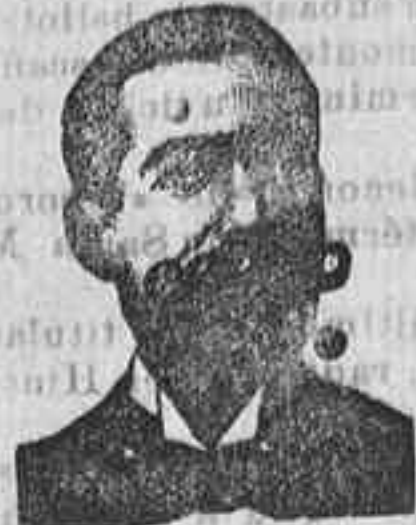
SALVATI COSTANZI Diputación, 435, Barcel.