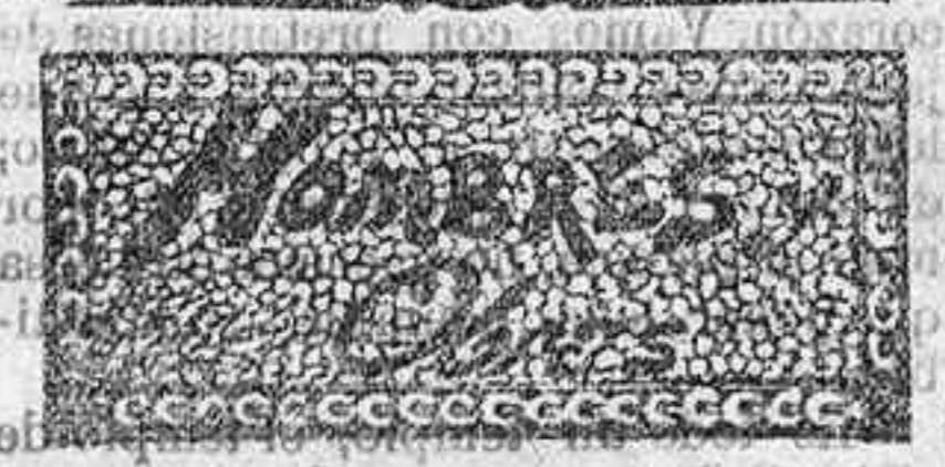
ALFONSO VII "EL EMPERADOR"

paña, la mencionada ley regiría ya como acontece en otros países. Pero hay que suponer que los llamados «padres de la patria», tan pronto como se reúnan oficialmente, legislarán acerca de tan trascendental asunto, que sólo por nuestro carácter apático y de abandono puede permanecer en ese estado. Estamos en período de reformas y nada mejor que introducir modificaciones e implantarlas en los servicios que tienen relación de esta con la salud pública y con la conservación y engrandecimiento de la riqueza de nuestro suelo patrio.