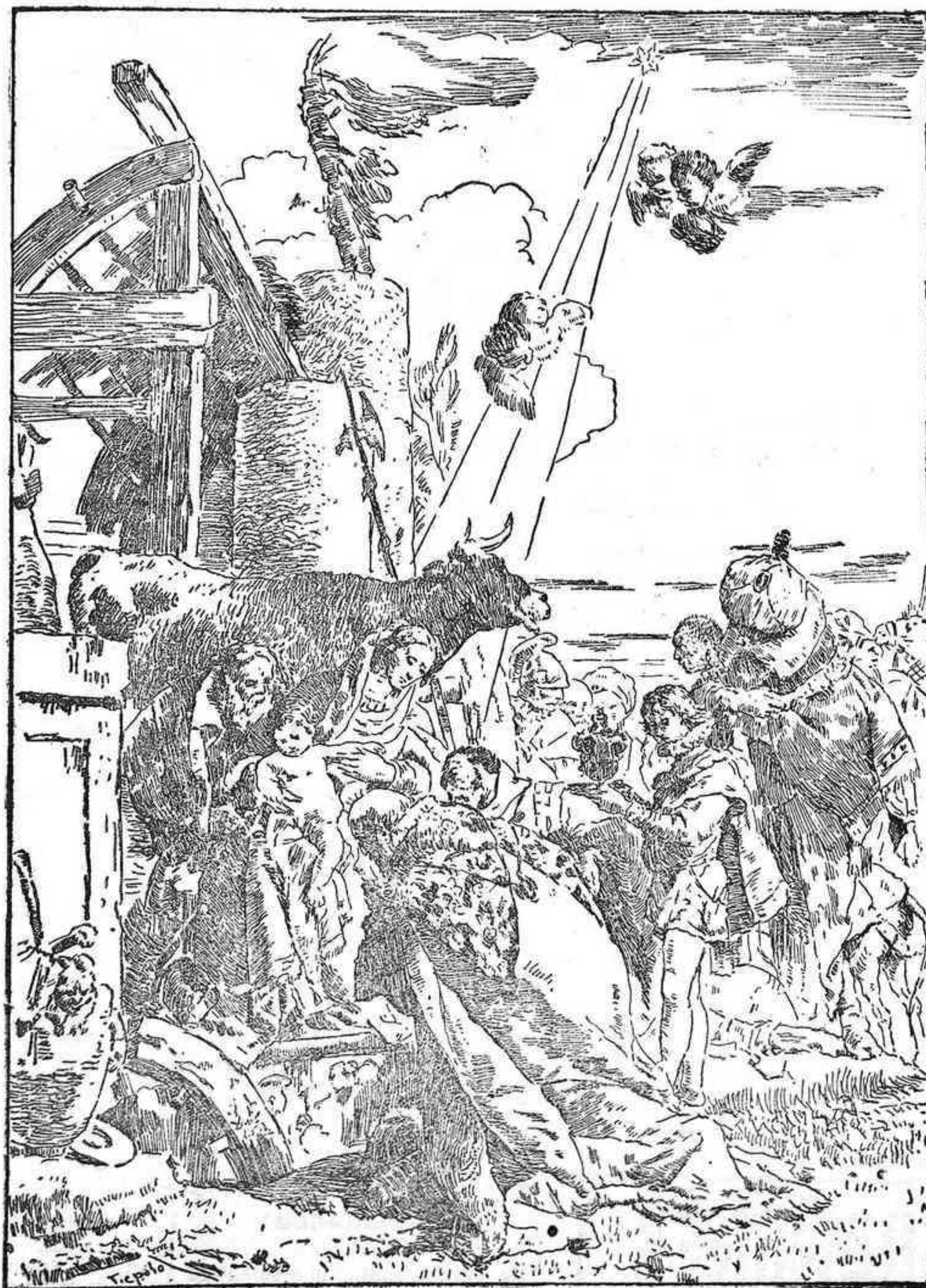
Famoso cuadro de Bautista Tiepolo

El engañar á los hombres, fué desde tiempos de Noé, ó algunos años antes, un arte provechoso para depararnos su cariño, y por lo tanto su dinero, y el tío palurdo, á quien para abreviar lo llamaremos desde ahora maese Ganzúa , siquiera porque maestreó en su nuevo oficio, dedicóse con alma y vida á un arte de engaño, que tambien, como ganzúa, servía por el envés y tenía cierto engaño de arte. Para no cansaros, os diré que nuestro hombre se metió á cómico ambulante. Con no escasa habilidad,