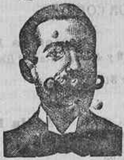
A. SALYATI COSTANZI Diputación, 435, Barcel.

Preparación la más racional para curar la tuberculosis, catarrros crónicos, bronquitis, infecciones, gripas, enfermedades consuntivas, inapetencia, debilidad general, prostración nerviosa, hipertensión, impotencia, enfermedades menales, caries, rquitismo, escurfulismo, etc. FRASCO, 2 pesetas. DEPÓSITO: Farmacia del Dr. Benedicto, San Bernardo, 41, Madrid, y en la provincia de Salamanca, farmacia del Lado Rodillo, Guijuelo.