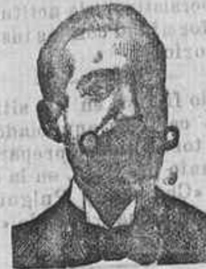
A. SALVATI COSTANZI Diputación, 435, Barcel.

Para orientarse se envía gratis y franco el prospecto oficial á quien lo pida