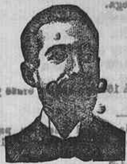
A. SALVATI COSTANZI Diputación, 435, Barcel.

Preparación la más racional para curar la tuberculosis, catarrros crónicos, bronquitis, infecciones gripales, enfermedades consuntivas, inapetencia, debilidad general, postración nerviosa, etc. FRA SCQ, 27, Depósito: Farmacia del Dr. Benedicto, San Bernardo, 41, Madrid. y en la farmacia de Salamanca, farmacia del Lido, Rodilo, Gagneles.