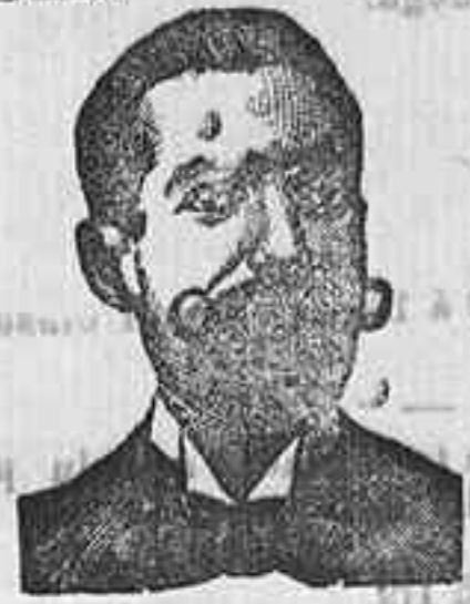
A. SALVATI COSTANZI Diputación, 435, Barcel.

Preparación la más racional para curar la tuberculosis, catarrros crónicos, bronquitis, infecciones gripales, enfermedades consumptivas, inapetencia, debilidad general, postración nerviosa, anemia, impotencia, enfermedades mentales, caries, raquitismo, escurfulismo, etc. FRANCISCO Y. CASAS; DEPÓSITO Farmacia del Dr. Benedicto, San Bernardo, 41, Madrid, y en la provincia de Salamanca, farmacia del Ldo. Rodilo, Guijuelo.