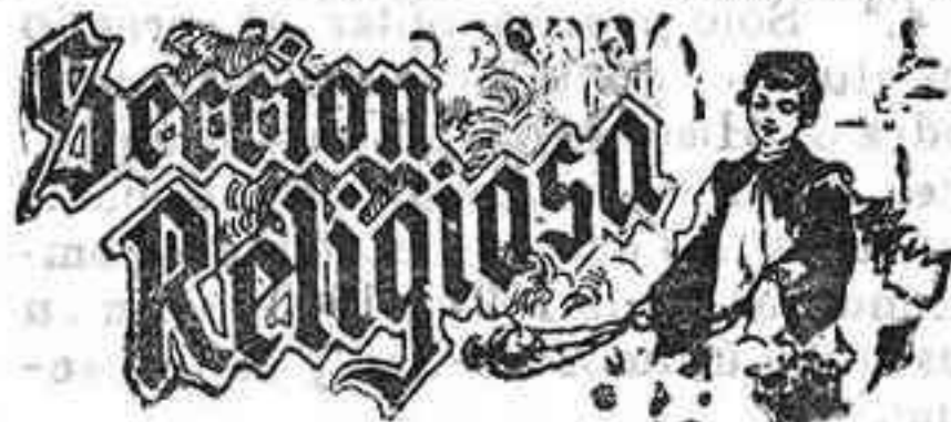
Mañana: Santos Casasio y Juan Casanove y Santa Irene, virgen y mártir.

Sus estrofas eran recibidas con estruendosos aplausos y aclamaciones. Ha sido, pues, un triunfo de imprescindible memoria el obtenido por el insigne autor de La Capilla de Lanuza y de El Anillo de Hierro entre otras obras de su inspirado número poético.