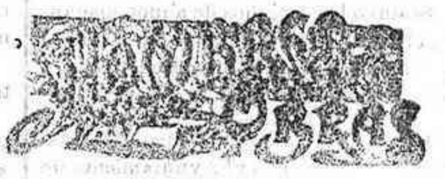
HEINE 13 de Diciembre.

Poco hemos de decir nosotros del notable poeta alemán Enrique Heine, nacido en Dusseldorf el 13 de Diciembre de 1800, genio romántico, ó mejor dicho, genio positivo, realista hasta la frivolidad y el cinismo, a la vez que en el fondo sentimental y dulce, verdadero lírico que encanta y conmueve el alma con sus imágenes delicadas y tiernas y sus palabras mágicas; pero dejamos la palabra al mismo Heine: