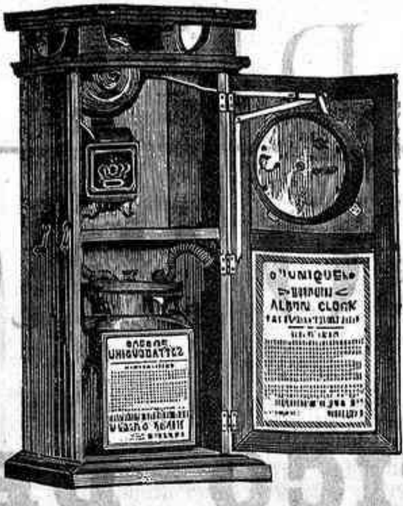
Despertador-eléctrico El Único .

Este despertador se construye por la Compañía Eléctrica Darche (Chicago), que registra las patentes, todas referentes á este objeto, y que sostiene que, siendo sencillo y cerrado completamente, no puede sufrir desperfectos; que es práctico en todo el sentido de la palabra, poseyendo los grandes méritos de que las piezas de acero del aparato de relojería no pueden sufrir la in-