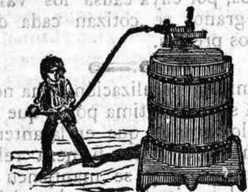
Máquinas de vapor.—Bombas.—Pesas.—Tubos de todas clases.—Aparatos para hacer gaseosas