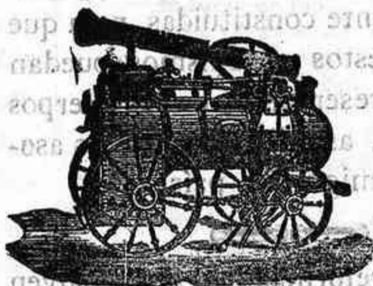
Máquina de vapor locomovil.

Catálogos gratis y francos à quien los pida