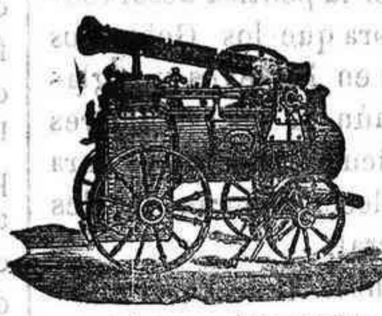
Máquina de vapor locomovil.

Máquinas de vapor.—Bombas.—Pesas.—Tubos de todas clases.—Aparatos para hacer gaseosas y toda clase de maquinaria.