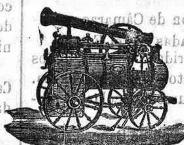
Máquina de vapor locomovil.