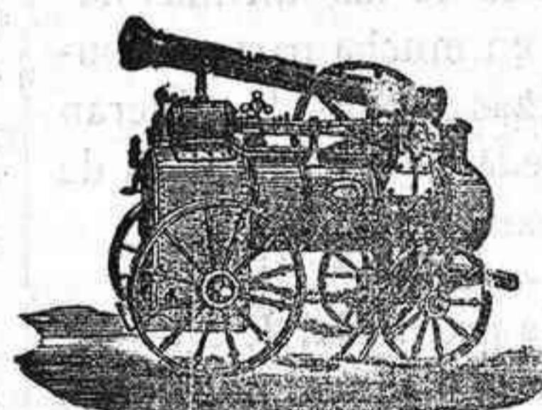
Máquina de vapor locomovil

Máquinas de vapor.—Bombas.—Pesas.—Tubos de todas clases.—Aparatos para hacer gaseosas y toda clase de maquinaria.