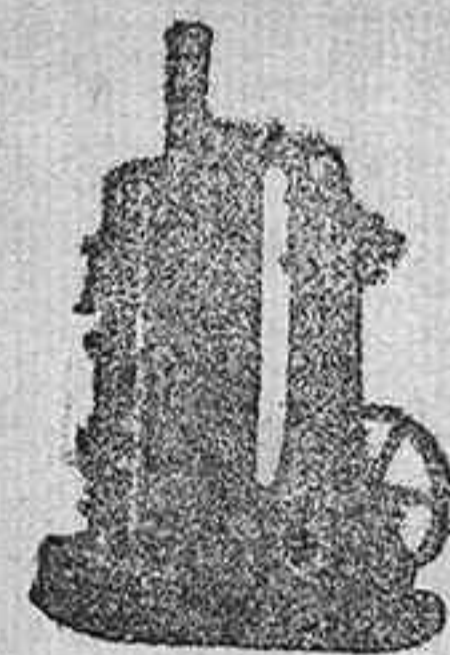
MAQUINA DE VAPOR VERTICAL.

Catálogos gratis y franco á quien los pida.