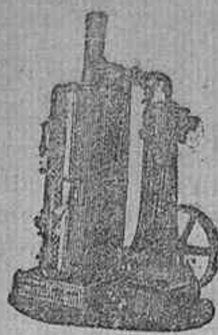
MAQUINA DE VAPOR VERTICAL.

Catálogos gratis y franco á quien los pida.