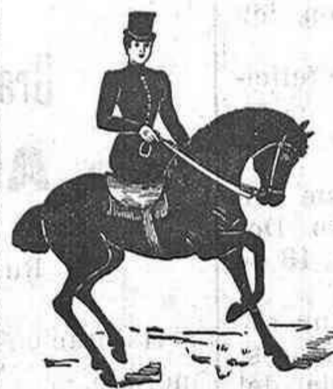
No confundirse: junto al Cuartel del Conde.