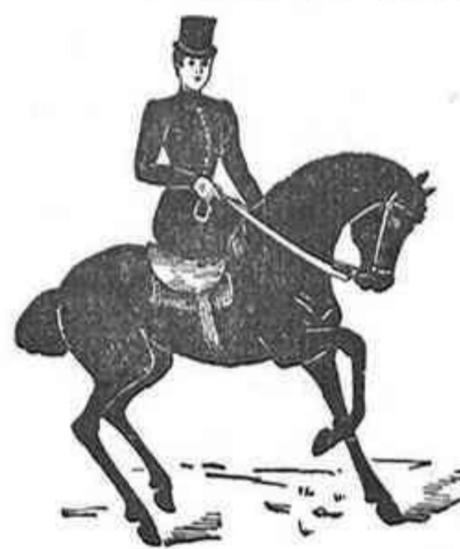
No confundirse: junto al Cuartel del Conde.