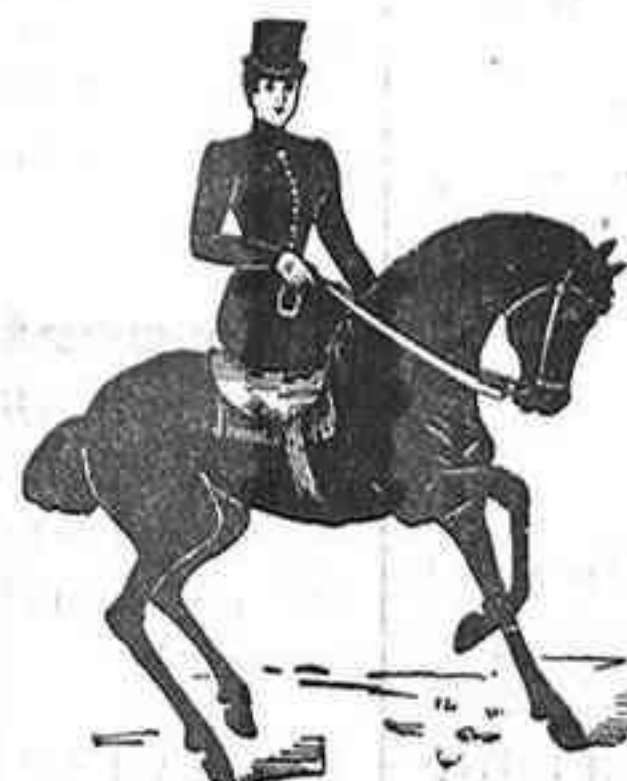
No confundirse: junto al Cuartel del Conde.