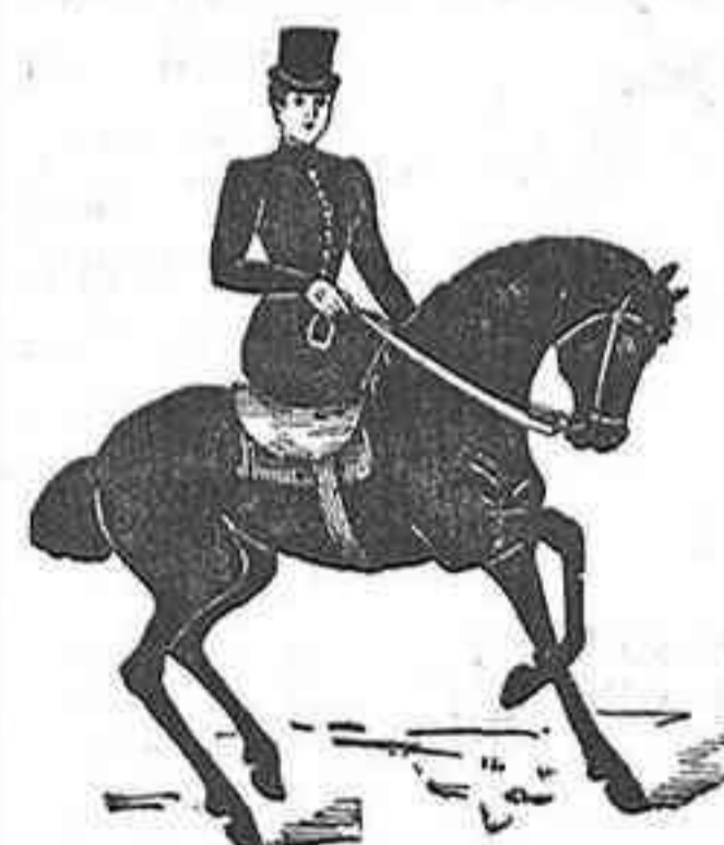
No confundirse: junto al Cuartel del Conde. 52-7