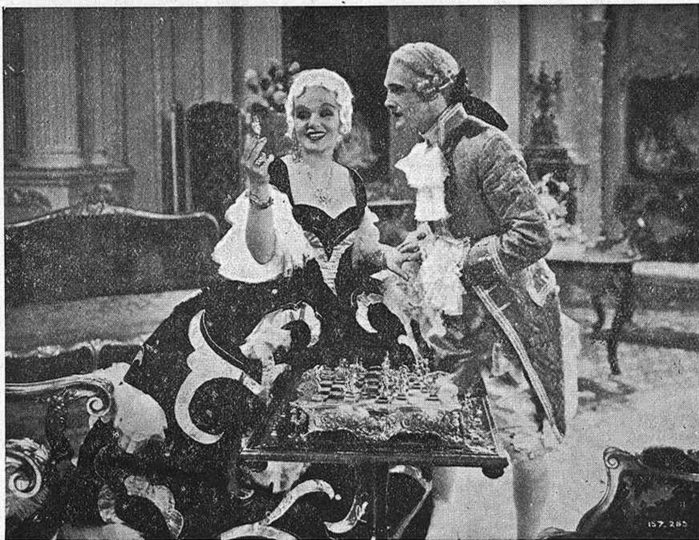
Una escena de la gran producción B. I. P. YO TE DOY MI CORAZÓN que distribuye Cifesa, en la que aparece su protagonista Gitta Alpar, positiva revelación del cine europeo.

atención de cuantos iban a ver a la artista precoz. De vuelta a Buenos Aires, la pequeña continuó dando muestras indudables de su afición y su talento para el canto y el baile hasta el punto que llamó la atención del empresario del teatro de la Comedia, en Buenos Aires, y en este escenario fué donde hizo su primera aparición ante el público. Como la incipiente artista no tenía todavía nombre artístico,