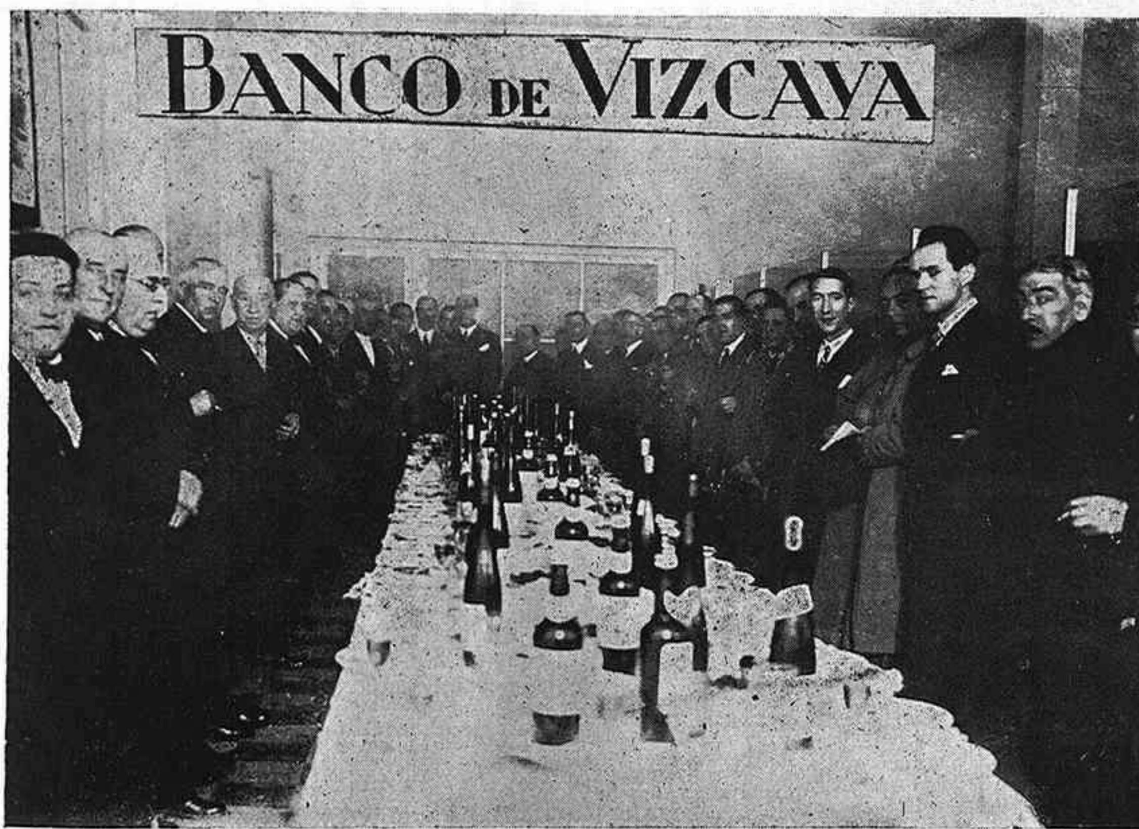
Acto inaugural de la Sucursal del Banco de Vizcaya en Córdoba.

Con motivo de la apertura de esta Sucursal del Banco de Vizcaya, hemos reci-