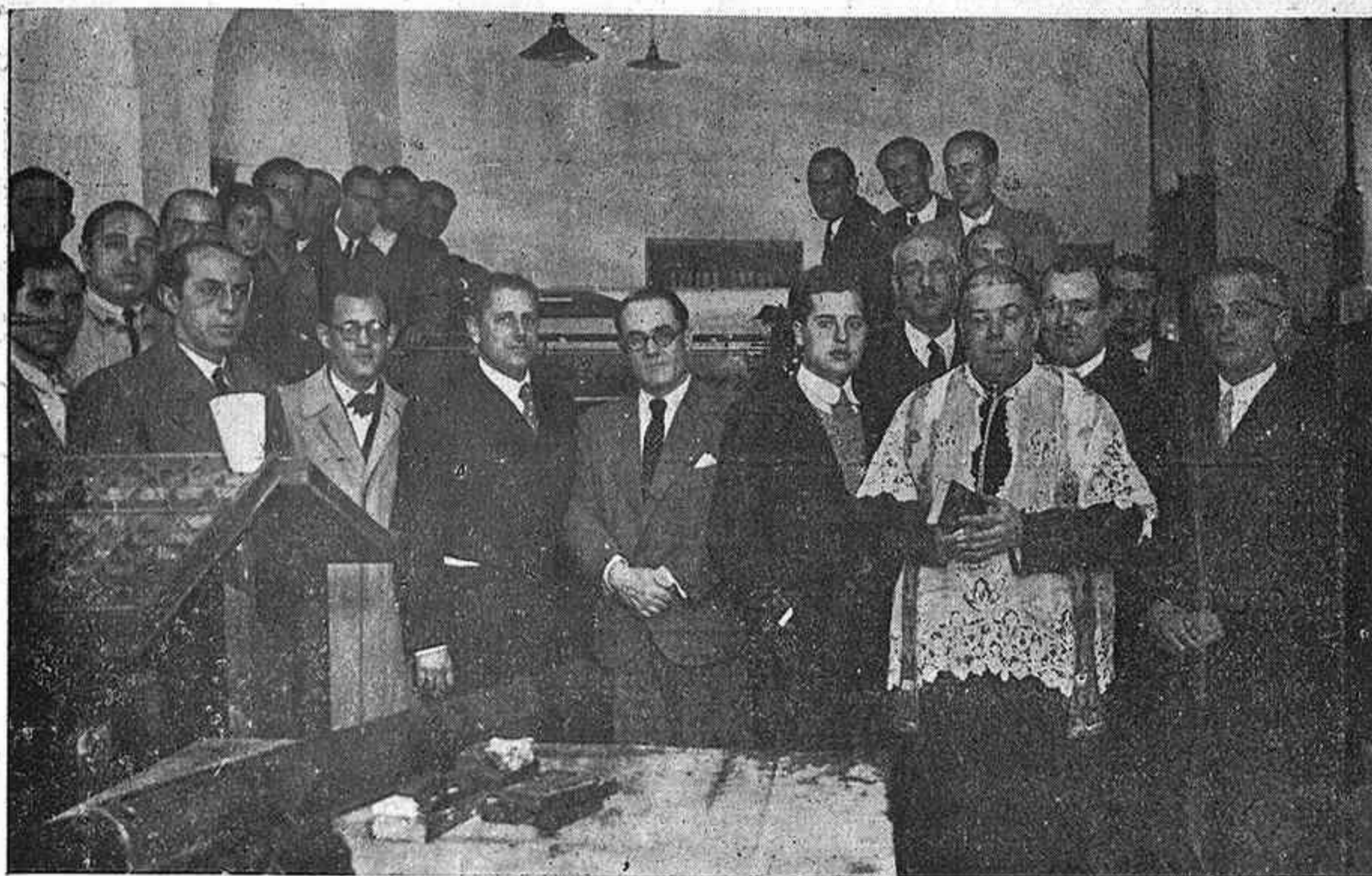
Bendición de los talleres del nuevo periódico cordobés «Guión» órgano de los partidos de derechas.