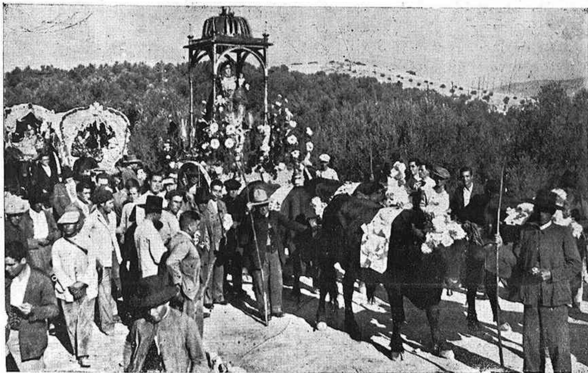
LUCENA.—La tradicional romería a la sierra que anualmente se celebra en este hermoso pueblo de nuestra provincia.