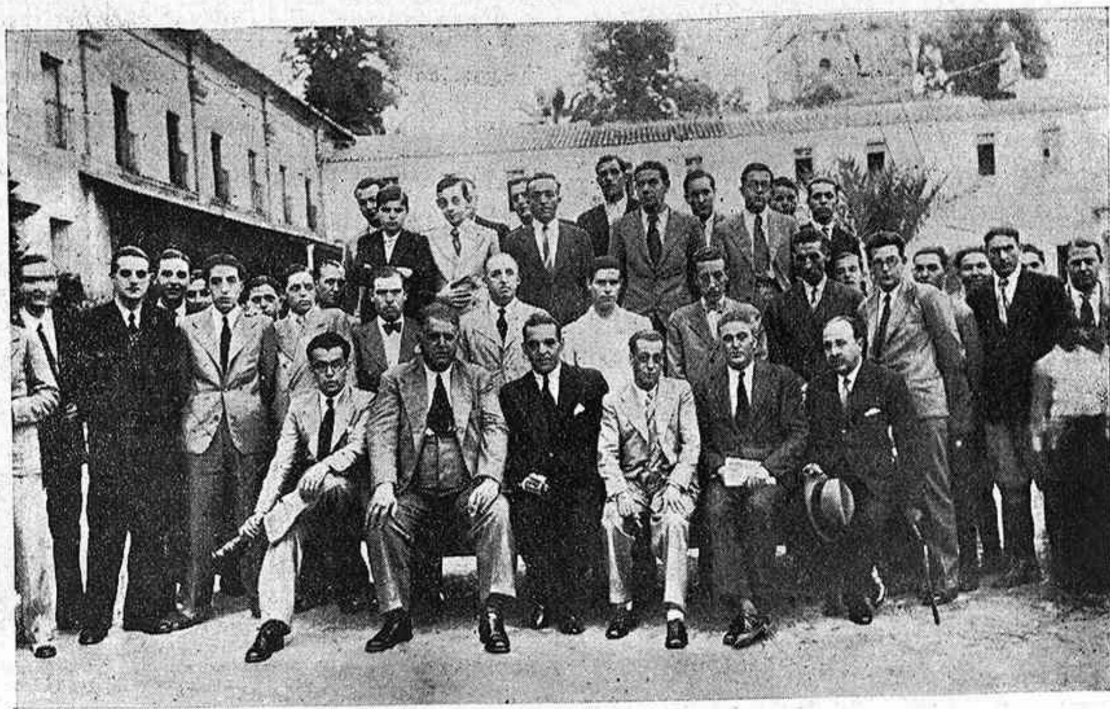
Concurrentes a las conferencias de Avicultura celebradas en los locales del Depósito de sementales.