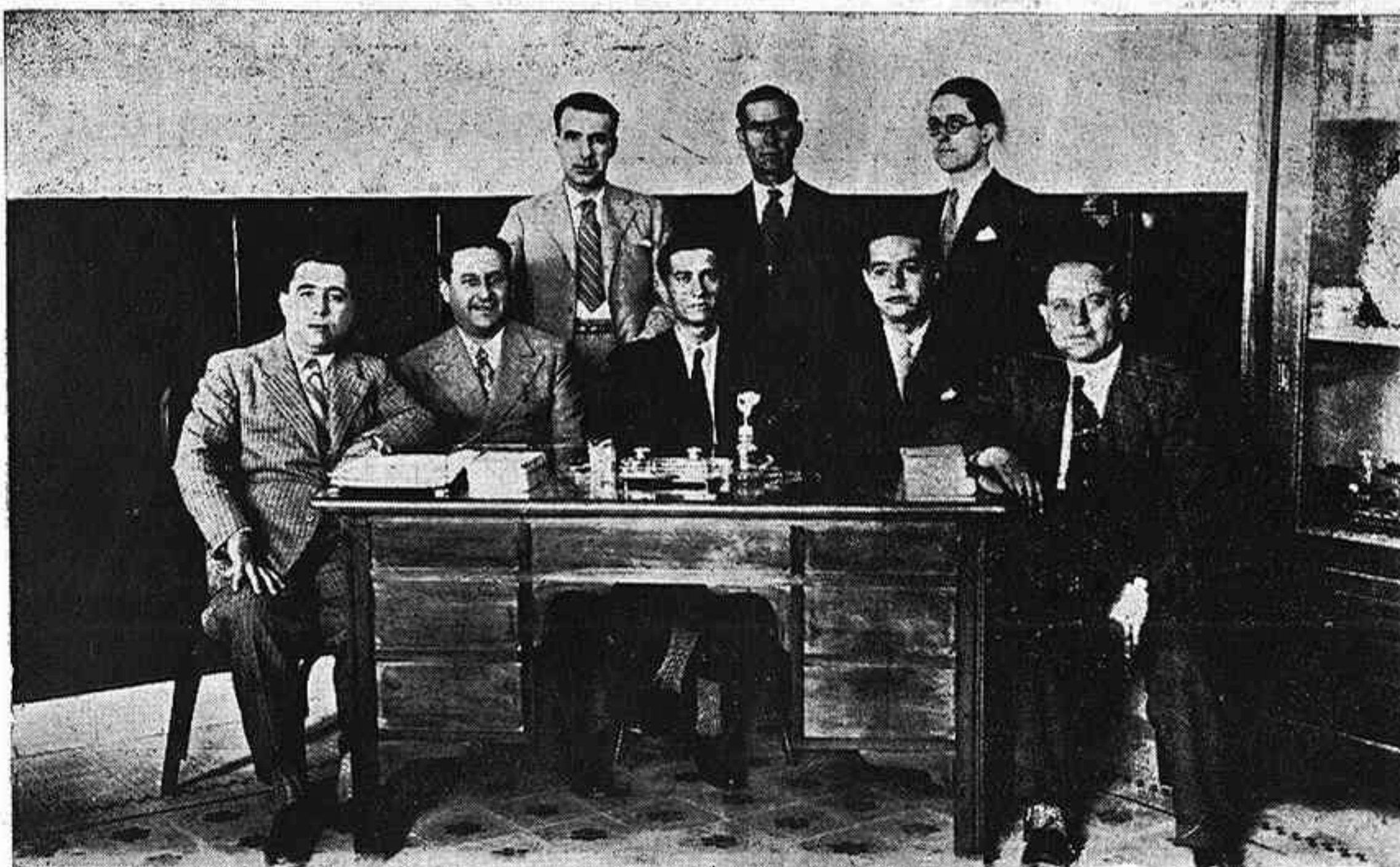
Los señores que integran la Junta Directiva de los Ferrovianos de la Zona 21, que están recibiendo múltiples felicitaciones por la buena organización de los actos celebrados con motivo de la Casa social y Escuela de los ferroviarios en Córdoba.