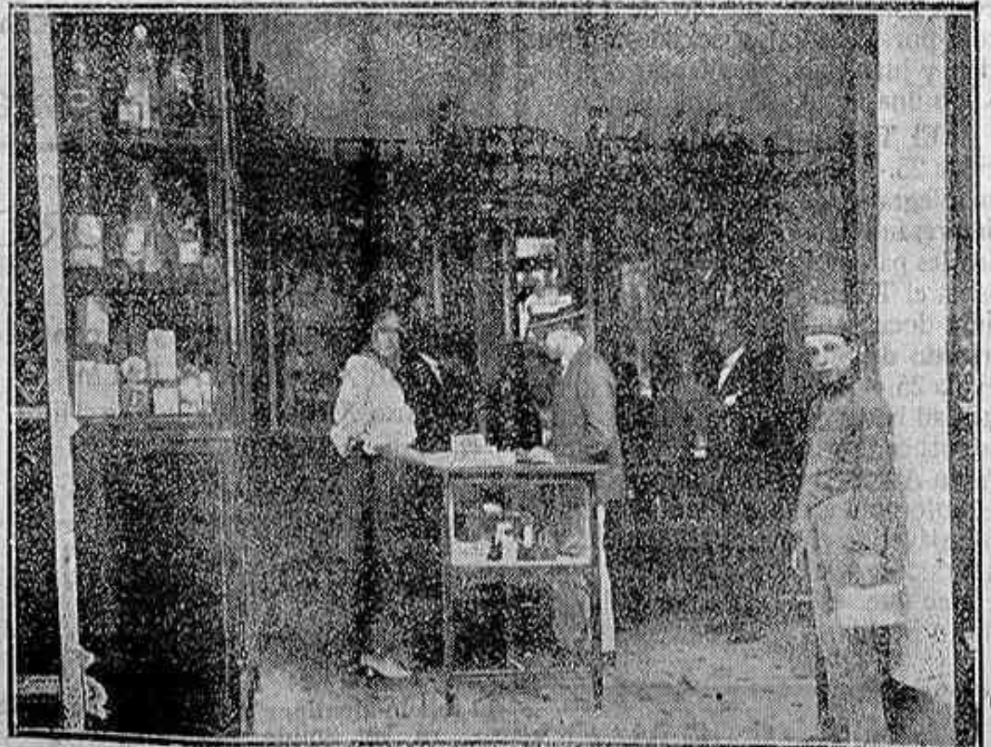
Sus artículos en perfumería, bolsos, guantes y objetos para regalos llaman la atención por su buen gusto y economía. CLAUDIO MARCELO, 12

ES EL ESTABLECIMIENTO DE MODAS EN CORDOBA