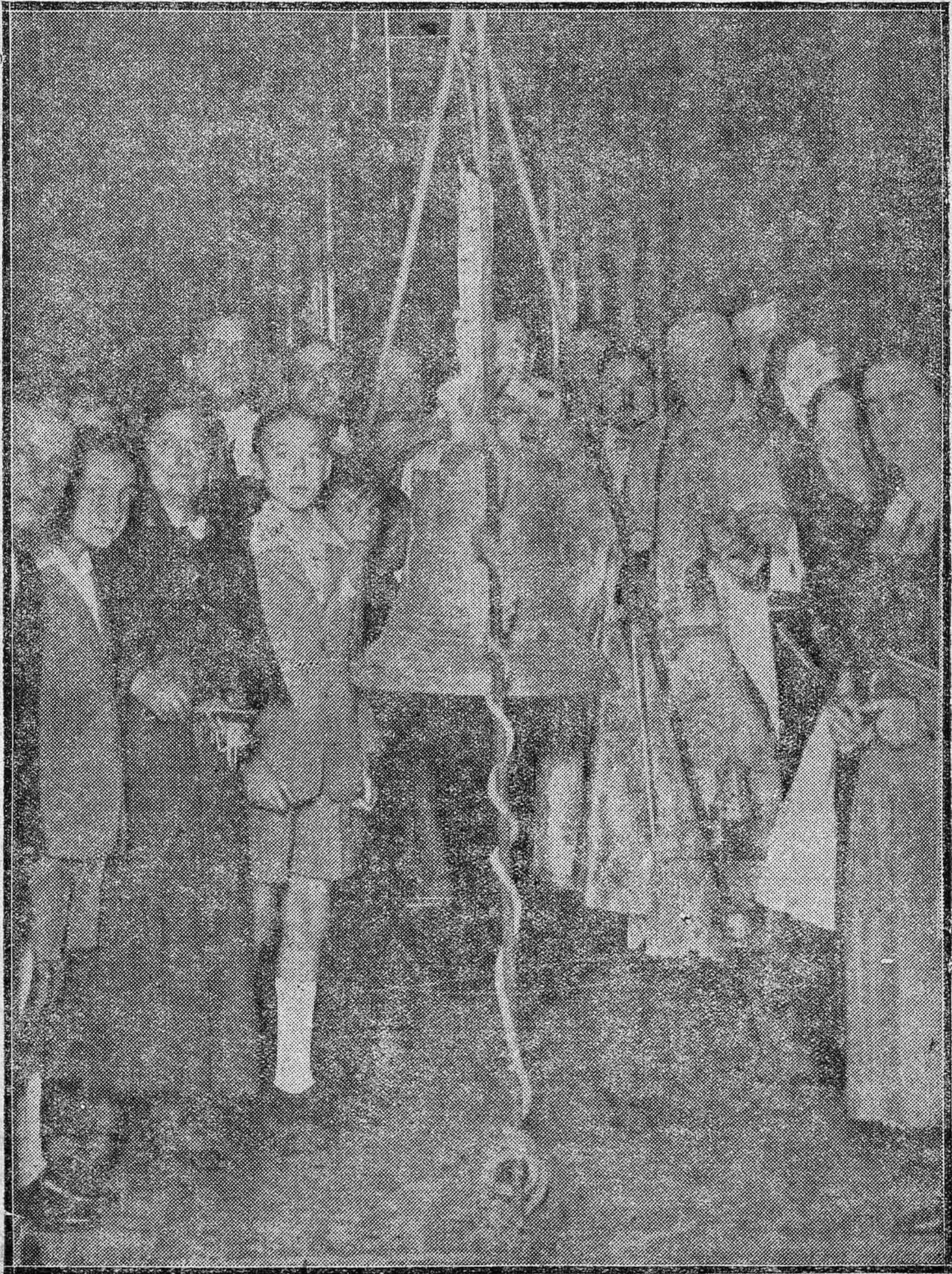
Solemne bendición de una campana para la parroquia de San Pedro, acto que tuvo lugar en la mis- ma ante las reliquias de los Santos Mártires.