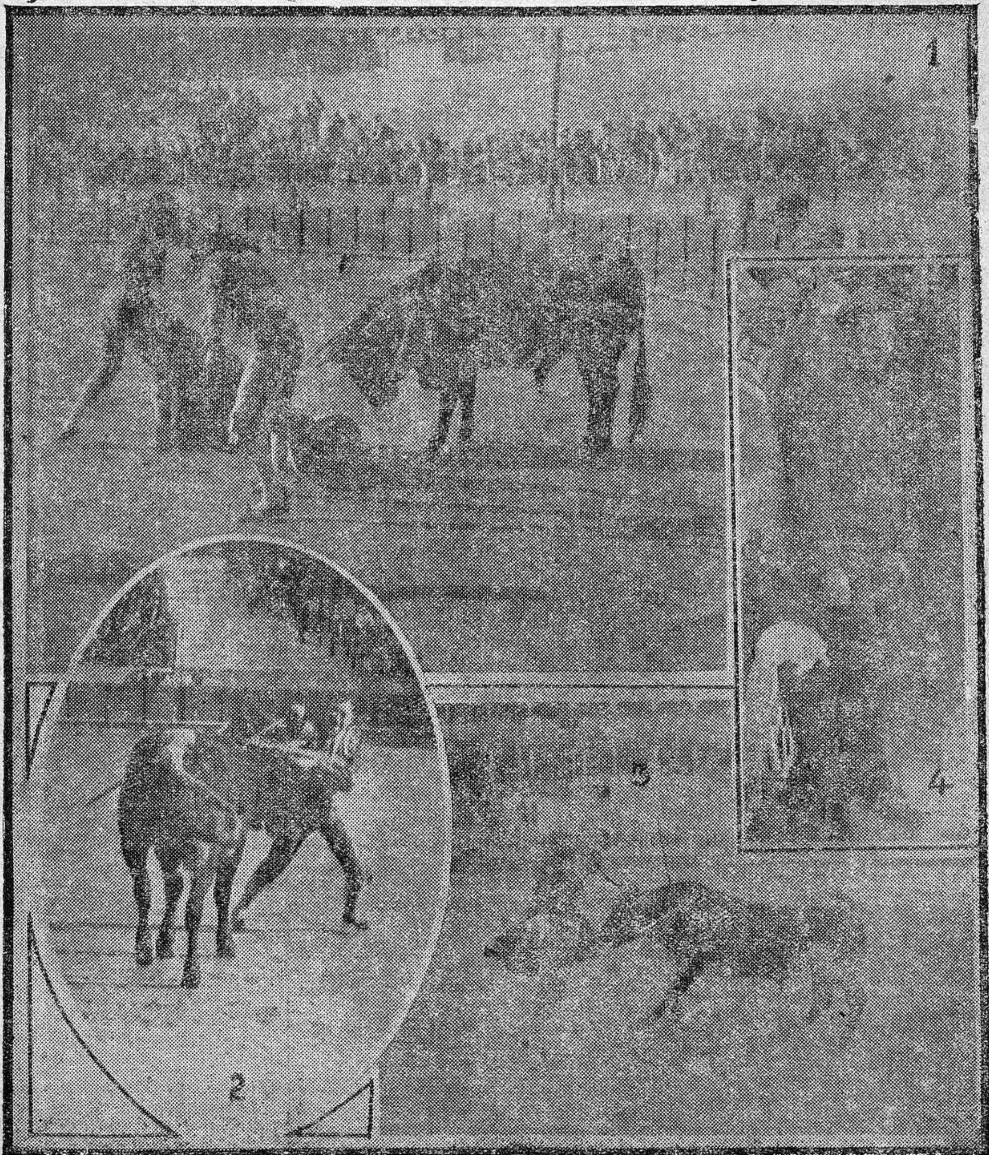
LA DESASTROSA NOVILLADA DE AYER.--1) Baquet en uno de sus innumerables Intentos.- 2) El fenómeno Bulnes, imagen de "Chicuelo,--3) Un natural de "Camará il",--4) "Pechete" el único que tuvo verdadero acierto toda la tarde.