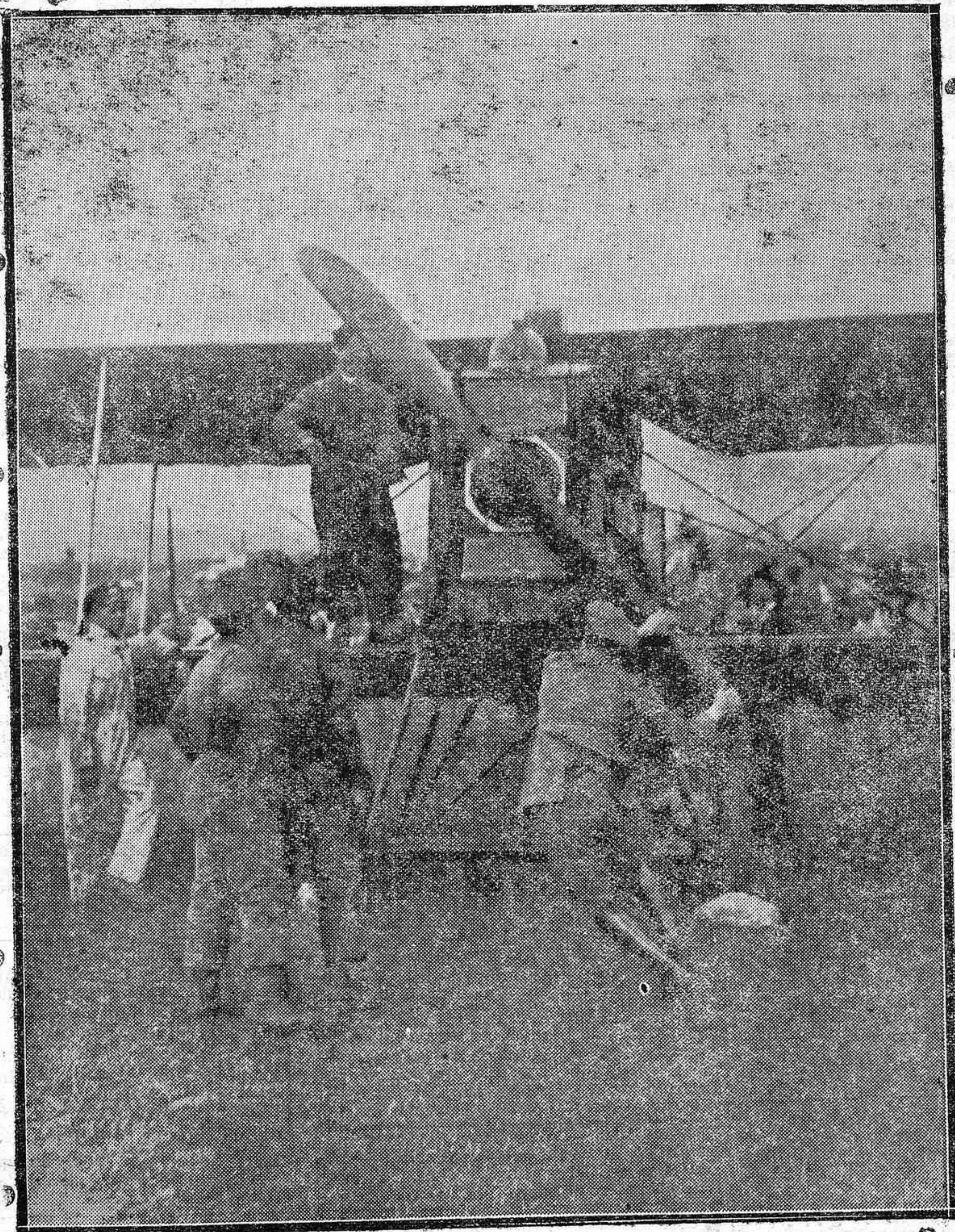
Uno de los aparatos que atterraron en Córdoba, para reparar averías en los que las han sufrido a su regreso a Sevilla y Marruecos.